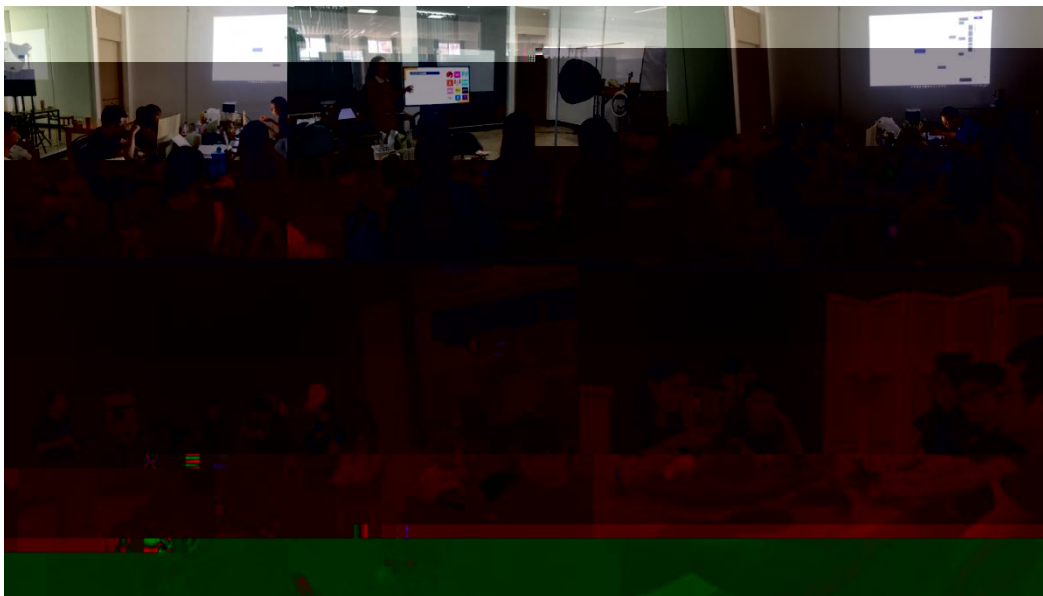
图 特邀企业专家来基地为学生进行专业培训

地 2023 地 ( 2), 供 宝贵的 。 过 的分 , 度 、 场变 , 对电 播 的 。 不 的 储备, 高 操 , 的 发 奠定 础。 措 合 的 度, 地 合 的 。